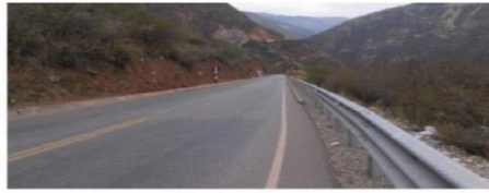
Foto 3: Progresiva Km 528+500, lado izquierdo de la vía. Actualmente el daño en el pavimento ha desaparecido por trabajos de conservación

Se encontró instalaciones hidráulicas aledaño a las cunetas a ambos lados de taludes compuestas por tuberías ambas de PVC de 38 mm de diámetro, expuestas y apoyadas a un lado de las cunetas, que cruzan la vía a través de alcantarillas. En todo el sector no se ha identificado fugas de la tubería pues el día de visita de inspección el flujo transcurría en forma normal pues se encontraba en pleno servicio.