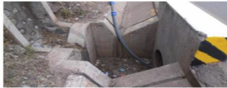
Foto 4: Tubería existente expuesta y apoyada a un costado de la cuneta

En la Foto 3 se observa el tramo bajo análisis en su estado actual. Se descarta que la causa de presencia de agua en la fecha que se produjo el daño haya sido ocasionado por rotura de la tubería. En la Foto