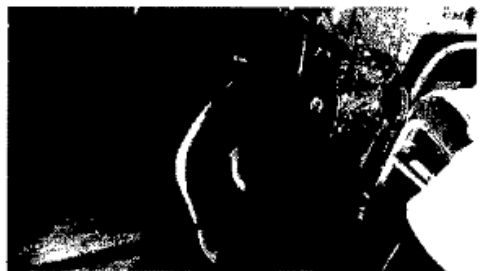
Respaldar de silla con tetones rotos y/o esquina de respaldar roto