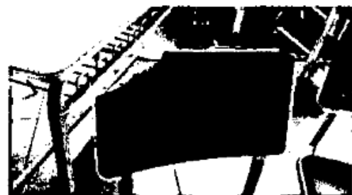
Asiento y respalda de silla roto