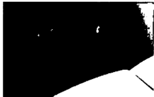
Asiento y respaldo de silla roto y oxidados por sectores