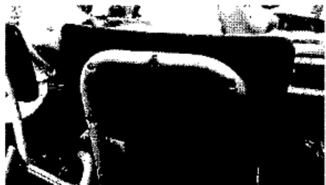
Existen dos modelos de respaldares de sillas, uno con la nervadura de baja altura (aprox. 0.3mm) y otro con la nervadura de 10mm aprox.