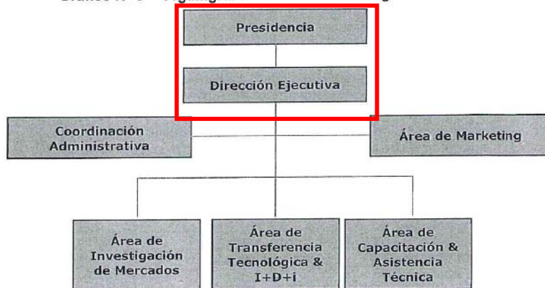
Gráfico N° 3 – Organigrama del CITE Marketing

Actualmente Mercadeando S.A., cuenta con un total de 7 personas como personal fijo (y cuenta con un staff de consultores externos dependiendo de la actividad a desarrollar). Dentro del presente Plan de trabajo se ha previsto que 3 puestos